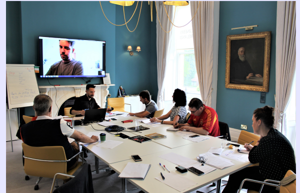
Alumnos y profesor en una de las clases de la novena edición del Curso intensivo de Inglés, celebrado en Dublín.

Debido al éxito de todas las ediciones anteriores, el COGITI ha organizado una nueva edición del Curso intensivo de inglés para Ingenieros, que en esta ocasión se desarrolla del 9 al 13 de julio en Dublín, y dentro del marco de colaboración que mantiene con la Asociación de Ingenieros de Irlanda (Engineers Ireland), desde el año 2014.